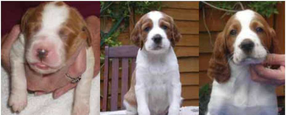
Spyefire May Spring Rainbow, genannt Scott mit 2 Tagen, 4 Wochen und 6 Wochen

Ein paar Tage später folgten Einzelbilder der Kleinen und da war er. JAWOHL... ihr lest richtig: ER! Ein kleiner Bub hatte mich in seinen Bann gezogen! Aber der Gedanke verflog gleich wieder; ich bin doch überzeugte Hündinnen-Besitzerin!!!