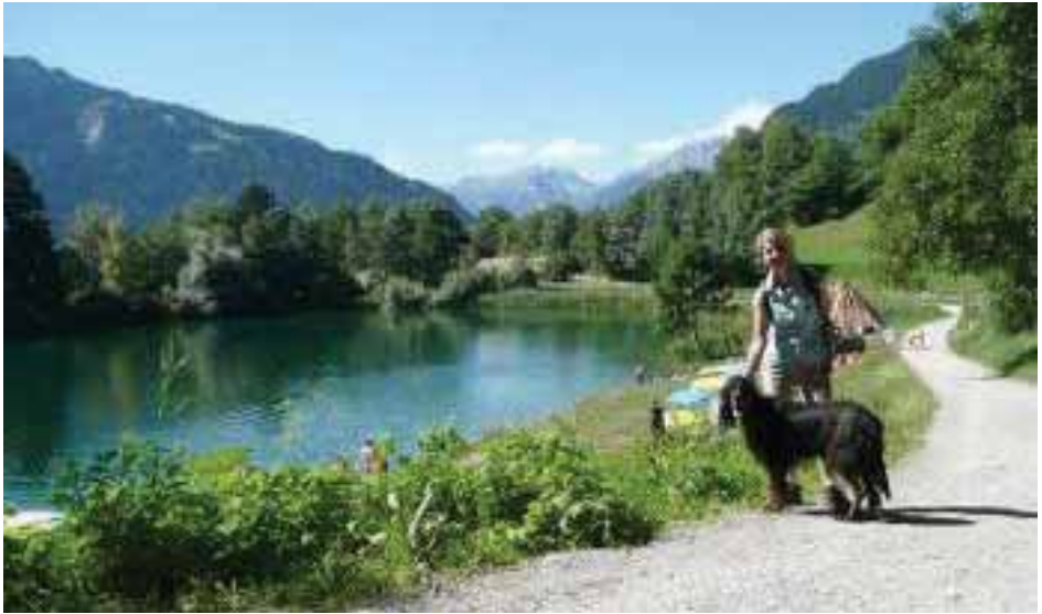
Pause am Canovasee

Auch hier haben wir eine schöne Höhenwanderung mit wunderbarem Panorama auf den Heizenberg gemacht, durch schöne Bündner Dörfer und Zora hat es genossen, in den wunderbaren Blumenwiesen rumzuschneffeln und Mäuselöcher auszukundschaften.