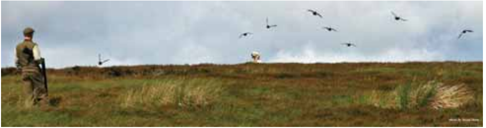
'A covey of Grouse' – ein Familienverbund hebt ab

Am 12. Juli 2010 war es dann soweit: unser erstes Field Trial in GB, genauer in Lauder, Schottland. Alles musste stimmen: die Kleidung (hoffentlich den Traditionen angepasst), das Benehmen (möglichst nach englischem Knigge), schliesslich die Leistung des Hundes (hoffentlich auf dem gewünschten Niveau und keine Blamage wie eine Hasenhetze vor versammelter Zuschauerschar).