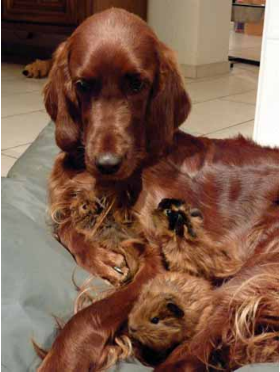
Es grüsst Stephanie mit Bajazzo und Eilyn-Ciara