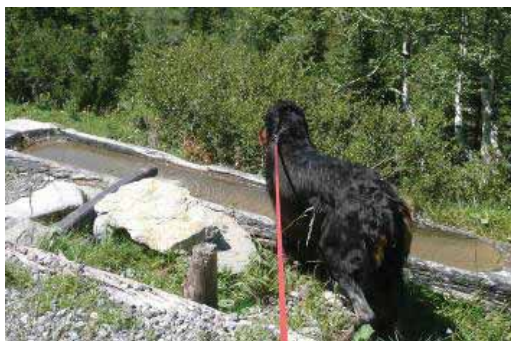
Wandern macht Durst