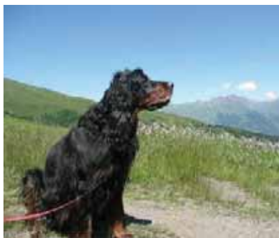
Frische Bergluft schnuppern

Ein Wochenende haben wir auch noch im Domleschg, in Paspeln in einem wunderschönen Hotel (eine Zeitinsel!) verbracht mit Wandern, Geniessen, Lesen.