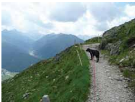
Kommst du endlich!

(Zora: „Na ja, ein Bad hätte ich schon gerne genommen, da waren mein Frauchen und Herrchen aber ganz strikt dagegen.)