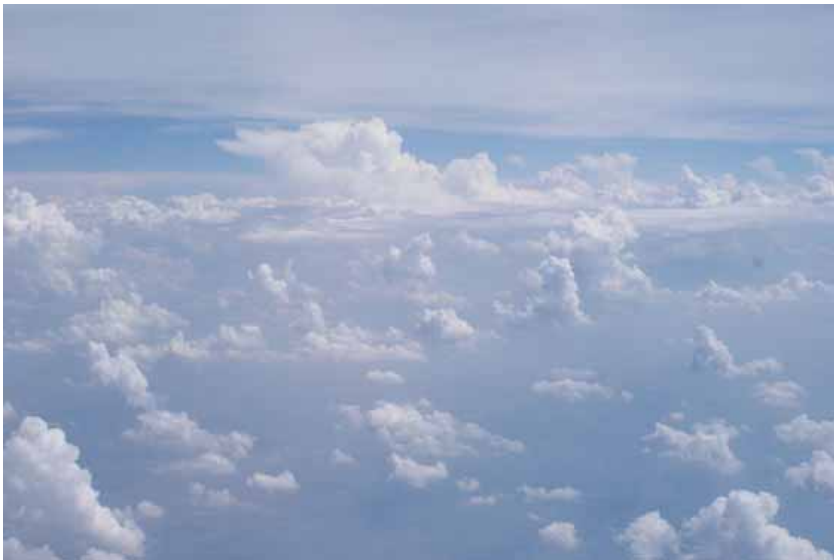
Über den Wolken...

Nun war also der grosse Tag gekommen! Der 30. Juni 2010! Da wir unseren Flug pünktlich erreichen wollten, haben wir uns für die Hinfahrt mit dem Zug entschieden. Mit einer guten Ferienstimmung haben wir unseren Flug relativ unspektakulär verbracht. Unser Flugziel war London Heathrow.