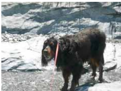
Das tut gut, so schön kühles Wasser