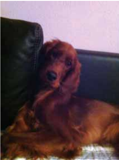
Im Oktober 2013 Brigitte, Bryony, Neva und Aileen

Dieses Buch wird also zugeschlagen – wie gut, dass uns unsere Setter bleiben!