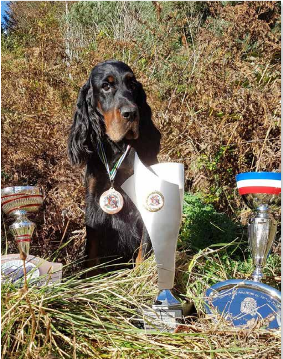
Fillies Gordon English Beauty