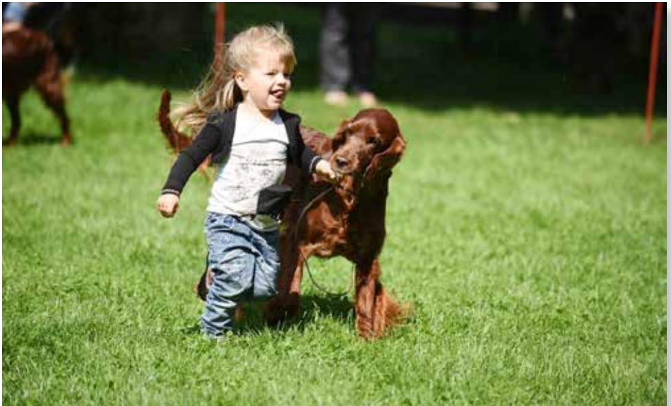
Die Zeit miteinander genießen