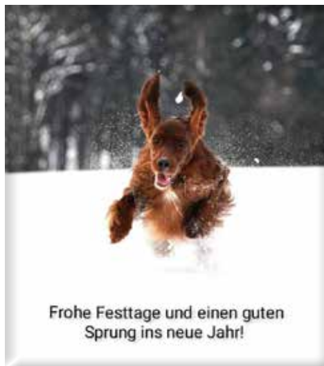
Karte: St. Galindo