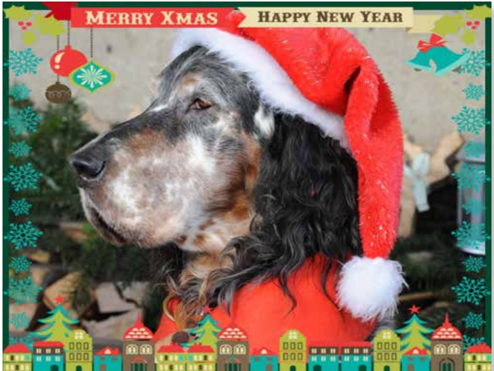
Karte: Ellen Minder