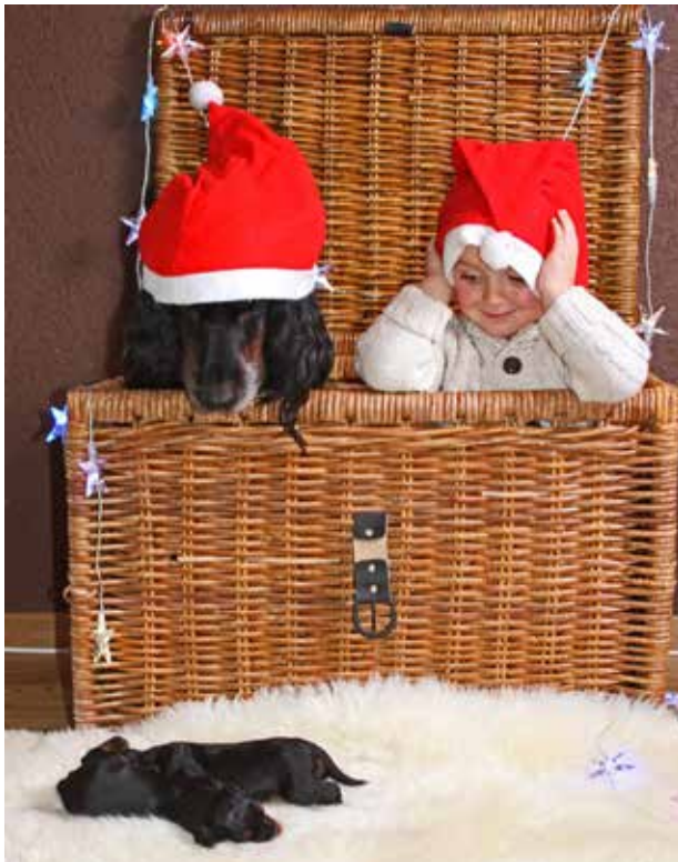
Karte: B. Barnetta

Die genauen Daten und die Ausschreibung / Anmeldung findet man hier: www.setter.ch zu finden. Les dates et l'inscription sont ici: www.setter.ch