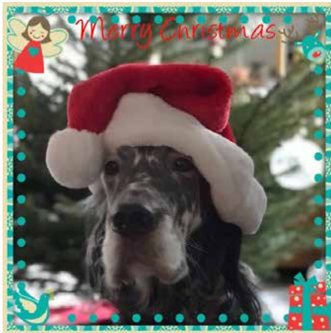
Karte: Ellen Minder