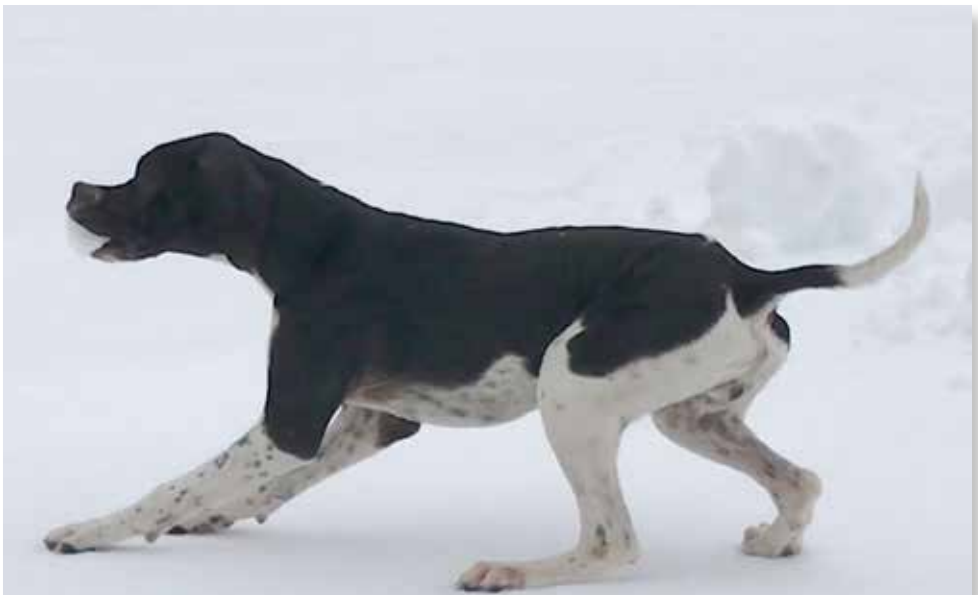
Porsche del Galazzo di Patrizio Biotti