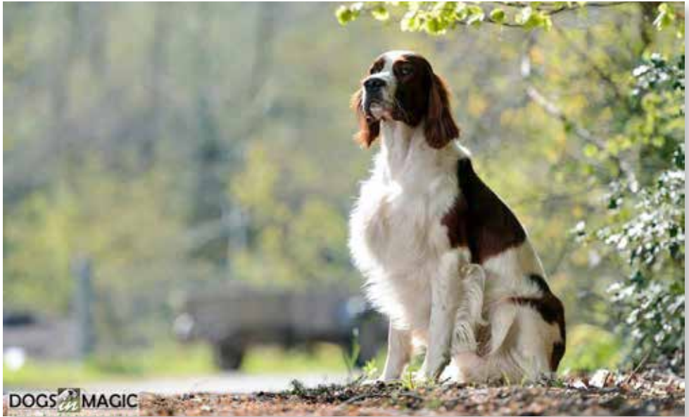
Schweizer Ausstellungschampion Vistador Bohemian Rufname Enea