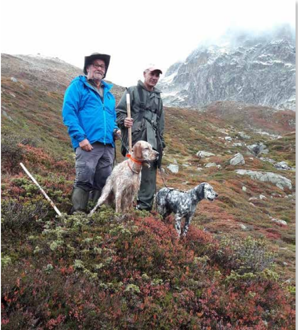
Sun del Zagnis, Ari dei Galli Forcelli