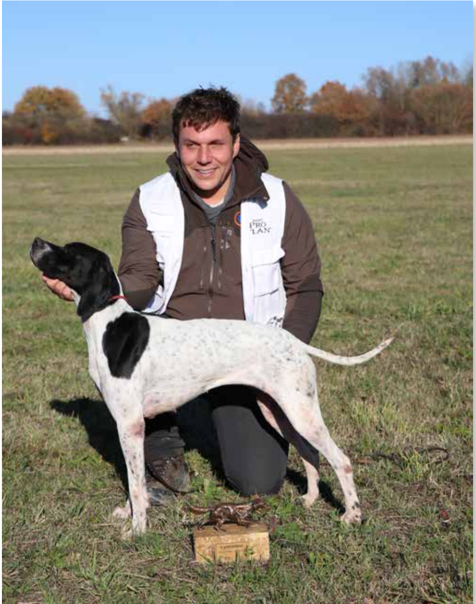
Milky Way De L'escalayole