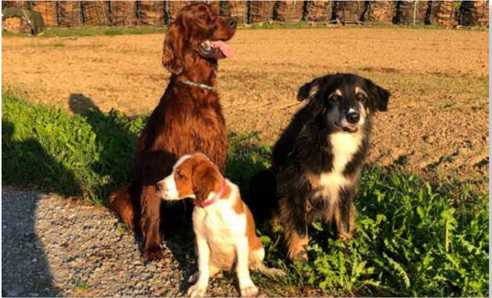
Vistador Down the Stars „Ben“, Spike und Vistador Fiery Silver Orchid „Vaiana“